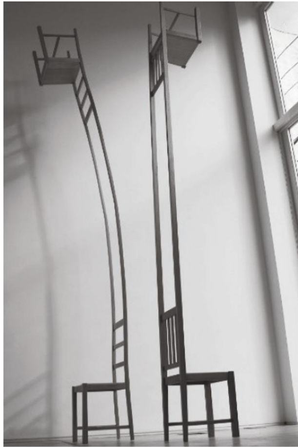
Figura 2 - José Spaniol. Cadeira e Lousas . Instalação realizada na Galeria Baró, São Paulo — Brasil, 2010.