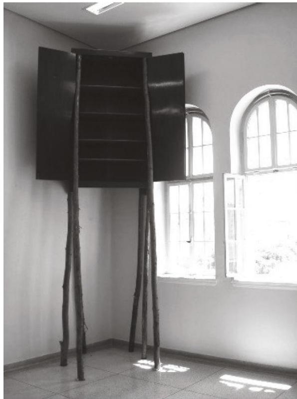
Figura 1 - José Spaniol. Ascensões , Instalação realizada no Mosteiro de São Bento, São Paulo — Brasil, 2010.

Em Ascensões , o artista esvaziou antigos e esquecidos armários pertencentes ao mobiliário do Mosteiro e os elevou até quase à altura do teto, devidamente sustentados por toras de eucalipto. "Foi o jeito que encontrei de me aproximar de um tema da religião" (Spaniol, 2010) (Figura 1).